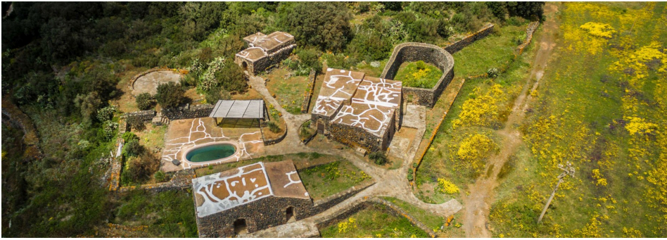
Immagini della struttura