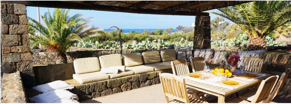
Immagini della struttura